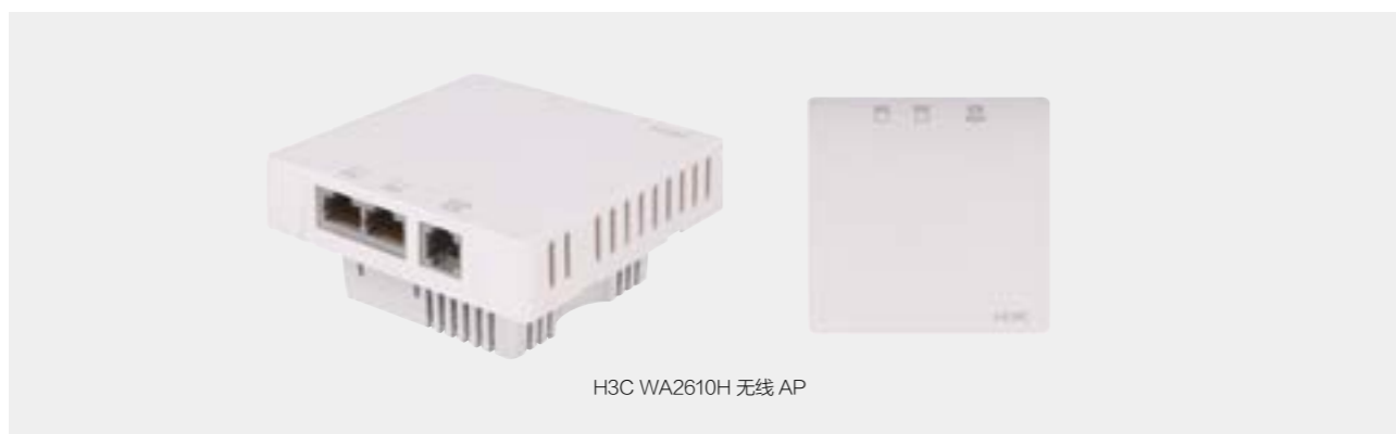
H3C WA2610H 无线 AP