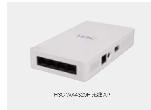
H3C WA4320H 无线 AP

H3C WA4320H 面板 AP 是新华三集团自主研发的新一代基于 2-Streams 11ac MIMO 技术的千兆高速无线接入设备 (以下简称 AP)，可提供相当于传统 802.11n 网络 3 倍以上的无线接入速率，能够覆盖更大的范围。安装方式简单，可在 86mm 面板的暗盒上安装，不破坏原有装修，可管理能力强，同时 H3C WA4320H 通过软件升级可支持 802.11ac Wave2 最新技术标准。