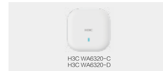
H3C WA6320-C H3C WA6320-D

H3C WA6320系列无线产品是新华三集团自主研发的新一代802.11ax AP产品,采用整机双频四流802.11ax设计,可广泛应用在企业、学校以及医疗等场景。